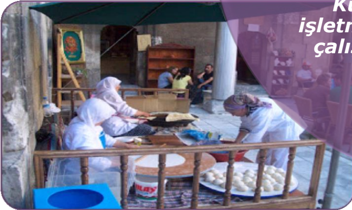
Küçük İşletmelerde Çalışanlar